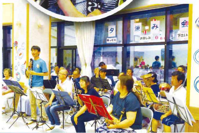
しろうま楽団による懐メロに酔いしれました。