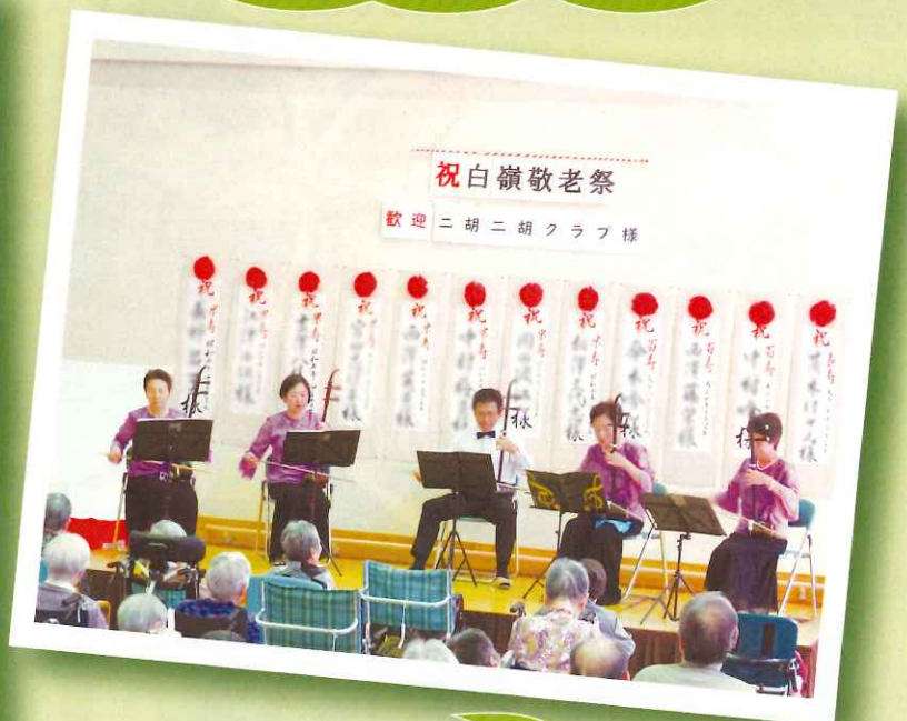
二胡の演奏を楽しみました。