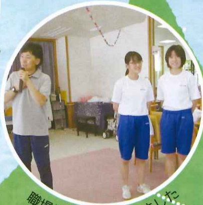
職場体験に来てくれました