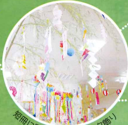
短冊に願いをこめて…七夕飾り