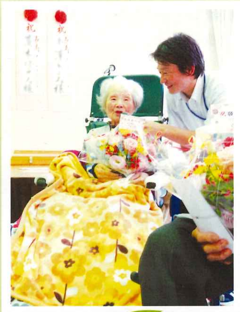
百歳のお言葉をいただきました。