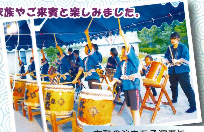
太鼓の迫力ある演奏に皆さん驚いていました。