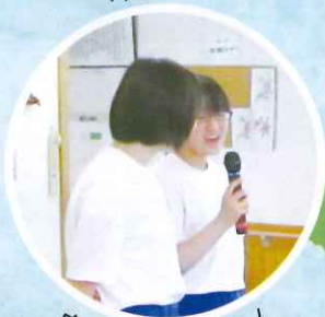
白馬中の生徒さん