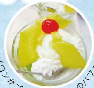
メロンがゴロゴロ！おやつのパフェ