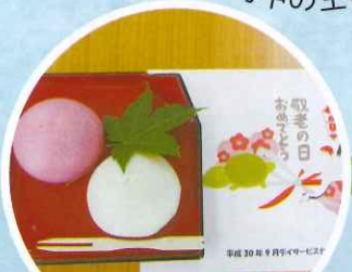
みなさまのご長寿を祈念して