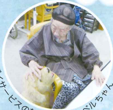
デイサービスの新しい仲間・ペルちゃん