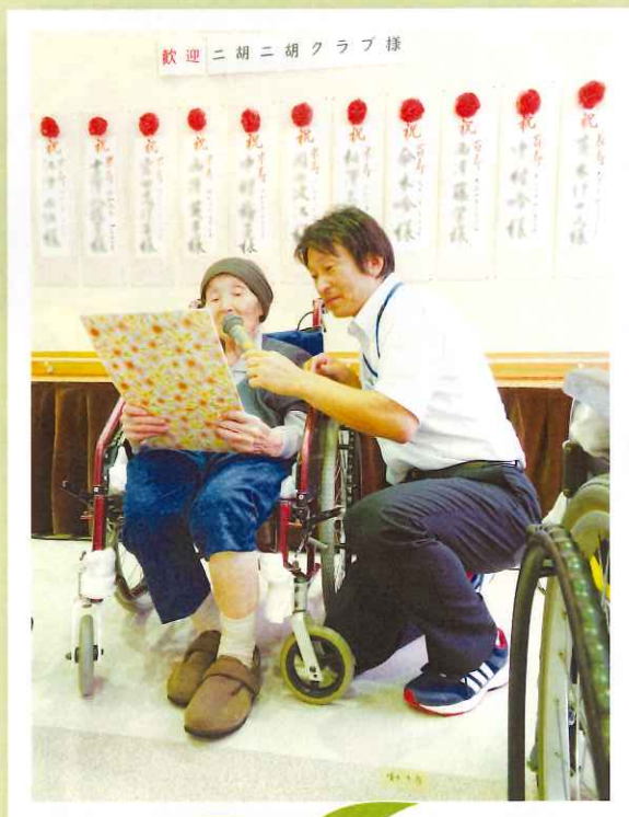
敬老のご挨拶をいただきました。