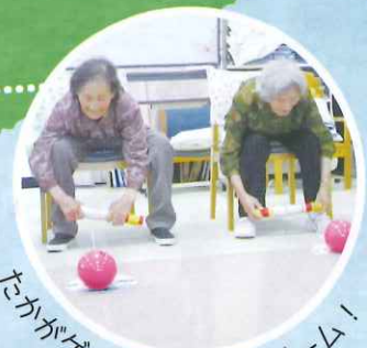
たかがゲーム、されどゲーム！