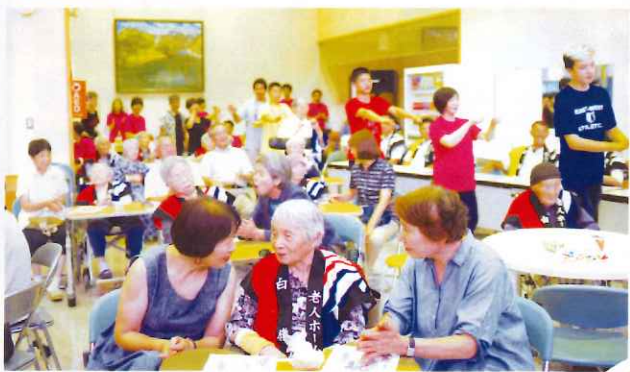
ご家族とのひと時を楽しめました。