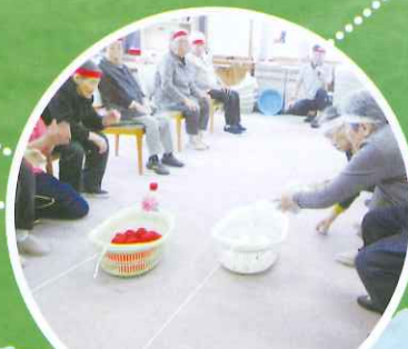
運動会といえば玉入れ！