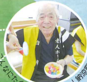
くんにたくさん抱えました！納涼祭にて