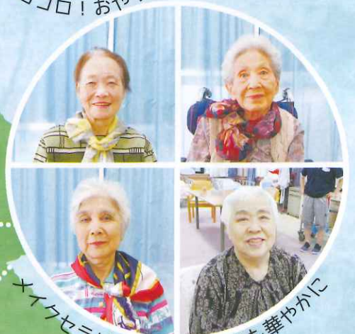
メイクセラピーでお顔も気分も華やかに