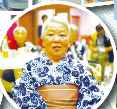
浴衣を着ました。よくお似合いです。