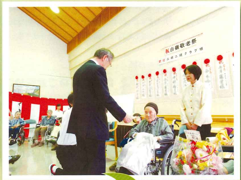
村長より敬老の表彰をされました。