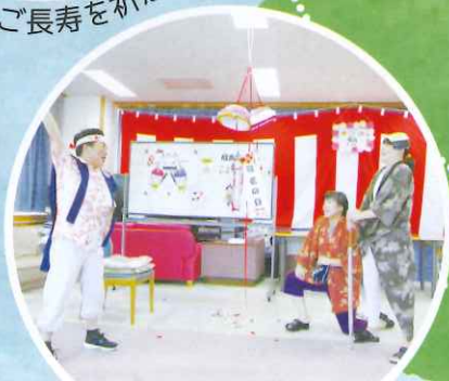
敬老祭では職員が劇を披露