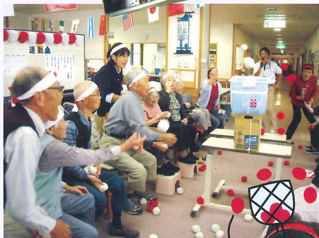
お弁当を食べて さあ勝負！ 気合い十分！