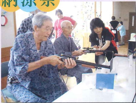
楽しそうに射的をする男性の方々。