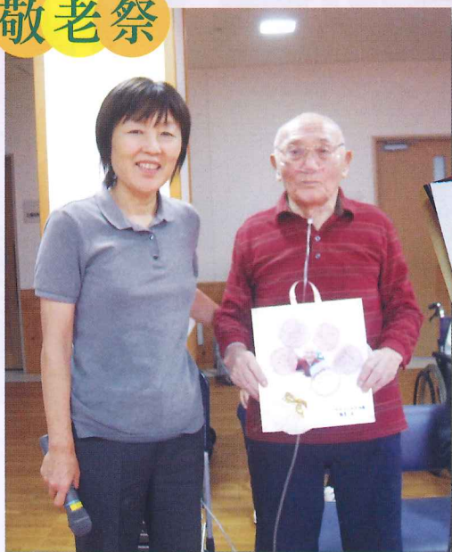
喜寿、米寿の方に心ばかりの手作り色紙をプレゼント。

美麻“さくら”の方をお招きしました。踊りは自然と体が動き出し、昔を思い出されたようです。