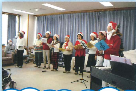
皆さんありがとうございました