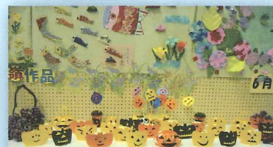
村文化祭に出品したり