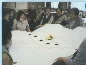
レク後 体を動かしています