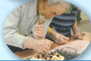
手作りケーキの出来栄は?