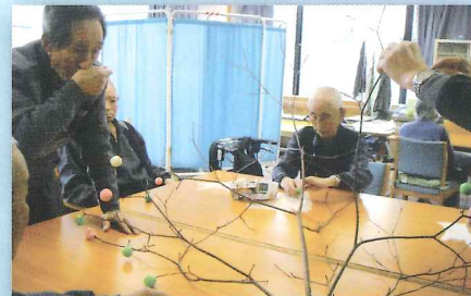
全員で力を合わせて作りました