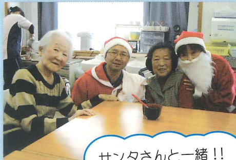
サンタさんと一緒!!