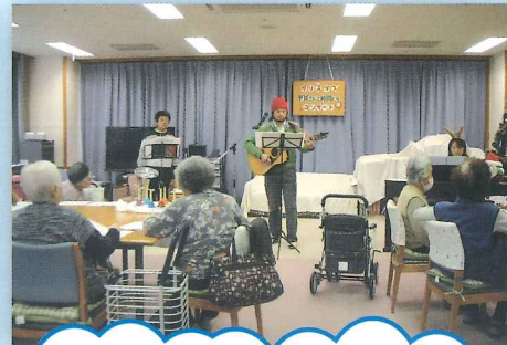
中谷さんと仲間たちが 駆けつけてくれました