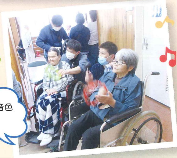
素敵な音色 ですね♪