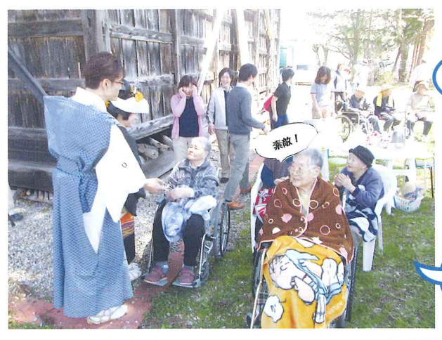
花嫁さんキレイですね。