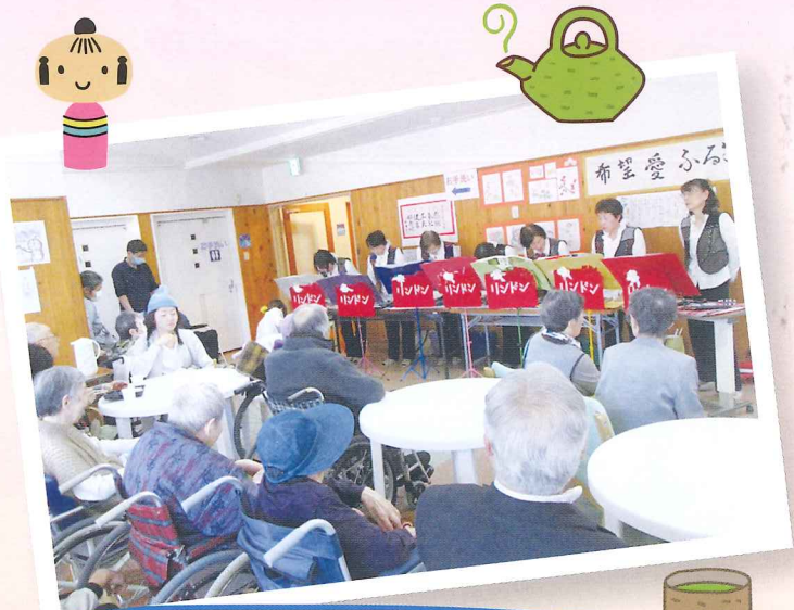
美味しいお菓子とお茶を頂きました。