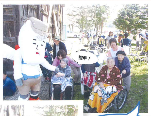
村男と一緒にパチリ!