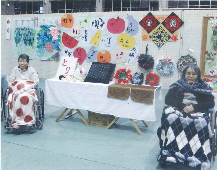
芸術の秋 (文化祭見学)