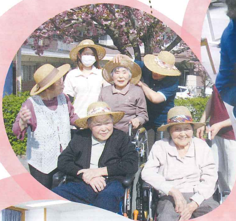
八重桜の下で記念撮影