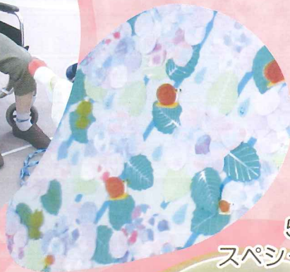
5月の スペシャルデザート わらびもち