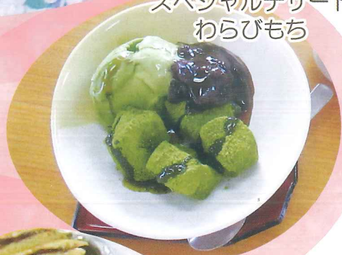
5月の スペシャルデザート わらびもち